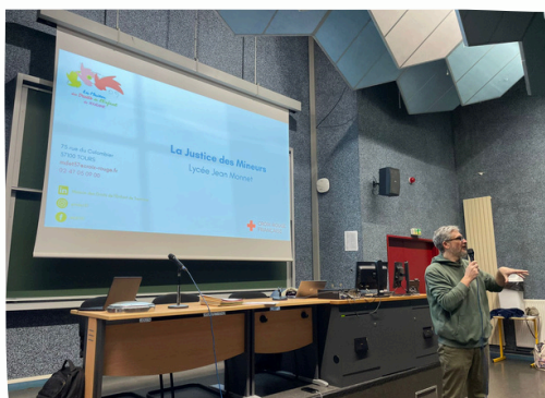
Lycée Jean Monnet à Joué-lès-Tours, justice pour mineurs