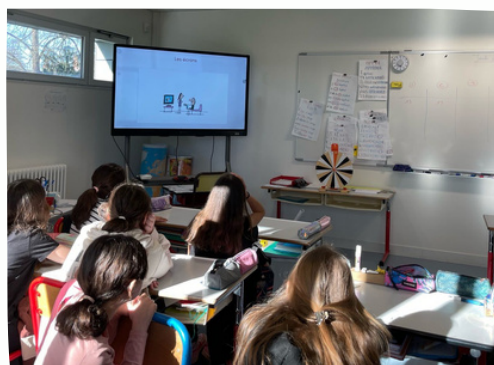
Ecole Richelieu à Amboise, intervention « Ecrans, Internet et réseaux sociaux »