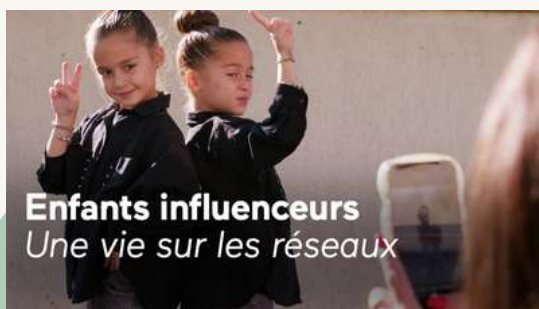
Enfants influenceurs Une vie sur les réseaux

France.tv Disponible jusqu'au 05/02/2026